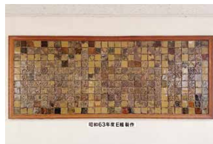
第八中学校生徒制作品

校章・校旗、校名板、校歌板、生徒の制作物、各種寄贈物、賞状・トロフィーなどを紹介。