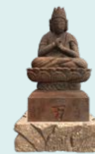
大日如来坐像 洞穴の奥壁にあるほこの床下に埋められていた仏像。

めぐろ歴史資料館の目玉展示、新富士遺跡から発見された胎内洞穴遺構を3Dでデジタル化しました。実際に自分が胎内洞穴遺構の中を潜り、探検するような没入感を味わえます。