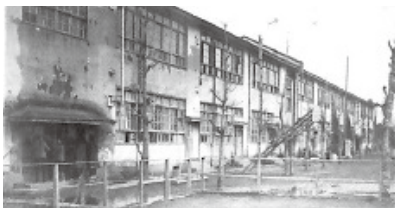
昭和22年頃の第八中学校