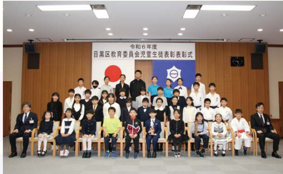
▲小学生の受賞者の皆さん(総合庁舎大会議室)