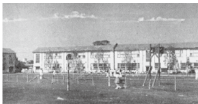
昭和26年頃の第七中学校

記念誌などに掲載されていた風景写真や航空写真、令和6年度に校内を歩きながら撮影した動画を紹介。