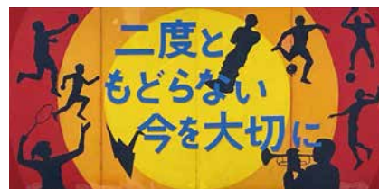
第七中学校生徒制作品