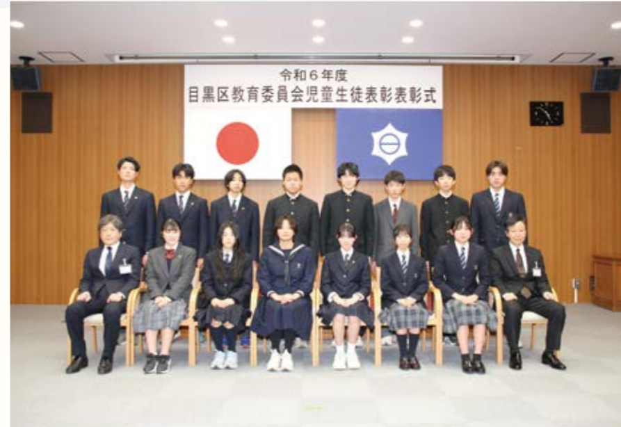
▲中学生の受賞者の皆さん(総合庁舎大会議室)