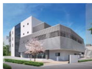
▲目黒西中学校の新校舎(旧第十一中学校跡)