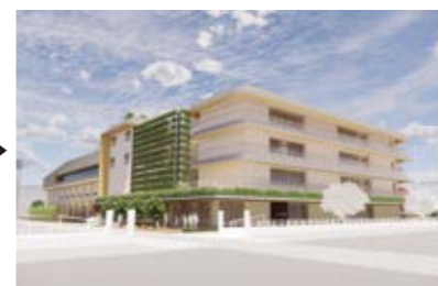
新校舎のイメージ▶