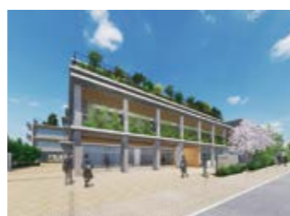
▲目黒南中学校の新校舎(旧第九中学校跡)

目黒南中学校及び目黒西中学校の新校舎整備に向けて、旧校舎解体工事及び新校舎建設工事を行います。