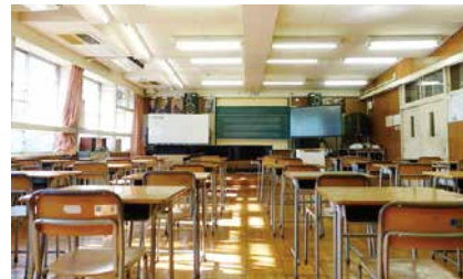
第十一中学校音楽室

令和6年度に全校生徒で歌った校歌の音源と学校の風景写真などをまとめた動画を紹介。