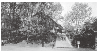
昭和31年頃の第十一中学校