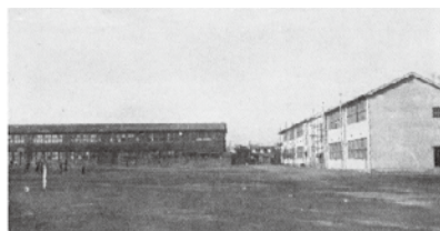
昭和24年頃の第九中学校