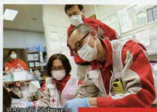
チームで取り組む災害救護