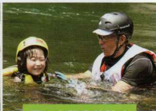
夏の水難事故防止

緊急時や災害時にいのちを救うための方法を伝える「救急法」の講習をはじめ、子どもたちやお年寄りが健やかな毎日を送るための知識と技術を広める「幼児安全法」・「健康生活支援講習」を行っています。夏には溺水による水の事故が増えることから、学校のプールや河川で水に親しみながら事故防止について学ぶ「水上安全法」の講習も展開しています。