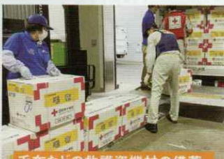
毛布などの救護資機材の備蓄・ 各地域への配備

災害時には、自分の身を守る行動(自助)と周りの人たちとの助け合い(共助)が大切です。防災セミナーでは、地域の特性を知り、いのちを守る方法を共に学ぶことができます。また、災害時の避難所で感じる、慣れない環境での負担を少しでも和らげられるよう、平時から緊急セット、安眠セット、毛布等の備蓄を行い、被災地にすぐにお届けできる体制を整えています。