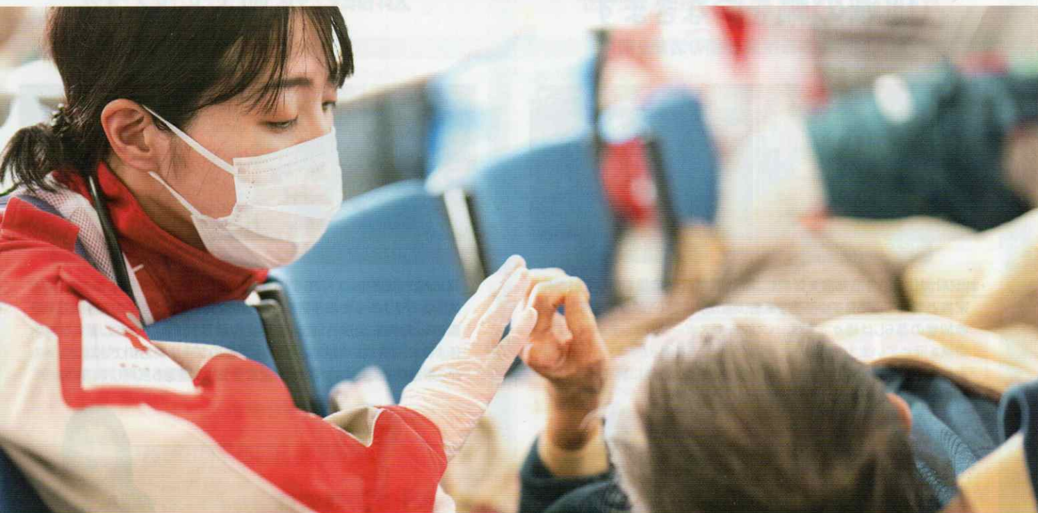
写真:被災された方の手を取る救護班(令和6年能登半島地震)